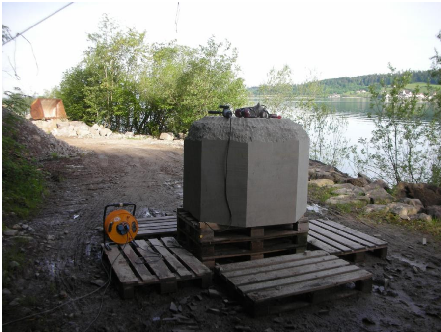
So fing die Arbeit am Becken an.