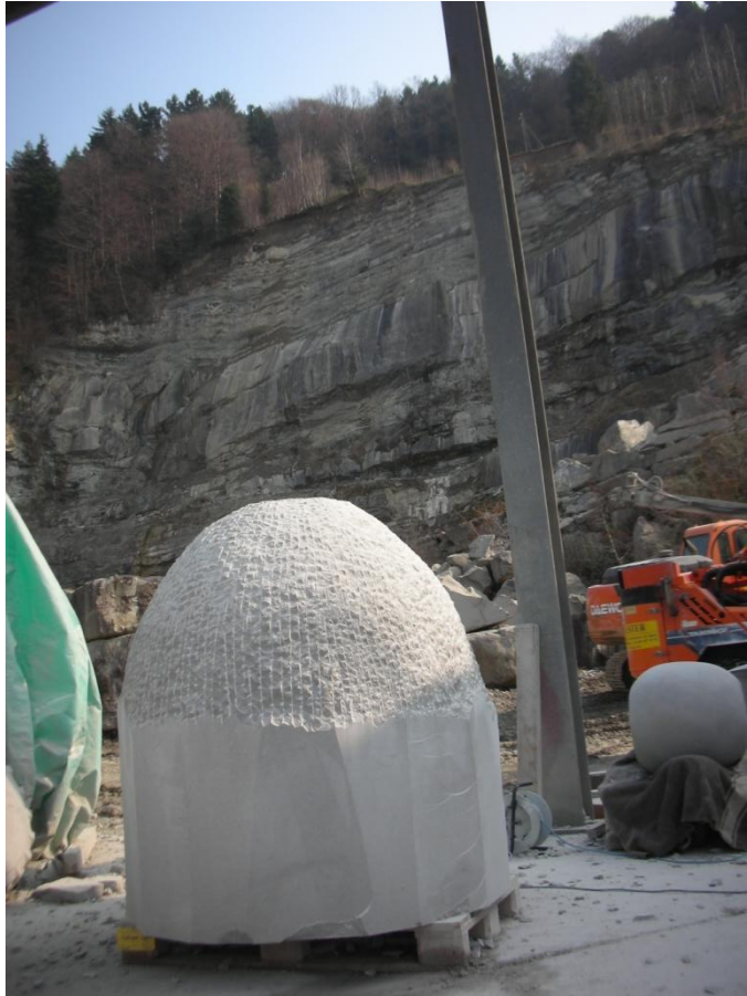
Zu einem früheren Zeitpunkt sind die Spuren des Meissels an der grossen Eibenbeere noch gut zu sehen.