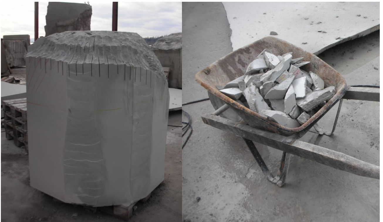
Mit der Flex hat die Künstlerin den Stein eingeschnitten, damit sie danach ganze Stücke wegschlagen konnte.