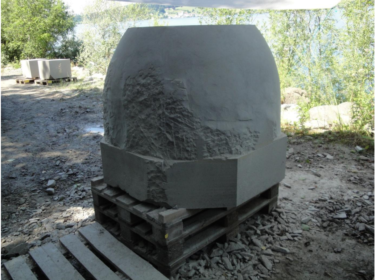
Abbildung 3: Der nächste Schritt beim Becken des Brunnens ist die Vertiefung für das Wasser.