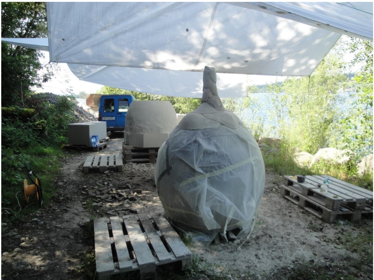
Abbildung 2: Das Freiluftatelier liegt wunderschön am Ufer des Zürichsees. Vorne ist die Eibenbeere mit dem Gipsaufsatz zu sehen, dahinter das Becken des Brunnens.