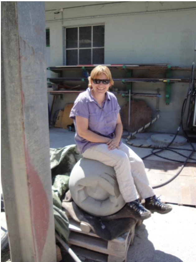
Abbildung 4: Sechs kleinere Eibenbeeren dienen als Sitzkissen.