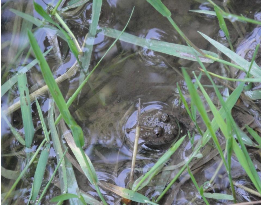
Mehrere Gelbbauchunken leisten der Künstlerin in ihrem Freiluftatelier Gesellschaft.

Die Fotos 2-5 sind von mir, die folgenden Fotos sind von Nadine Luchsinger: